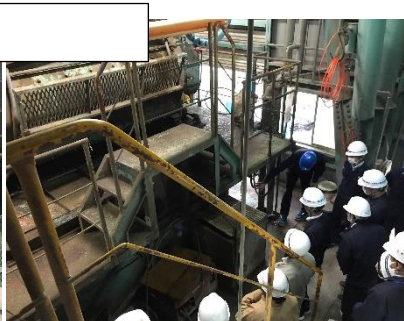
生コンクリート品質試験(スランプ検査)