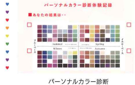
パーソナルカラー診断