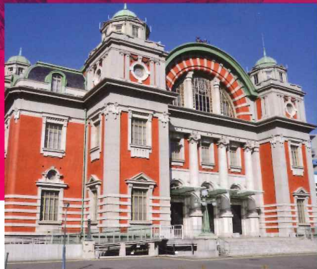
大阪市中央公会堂